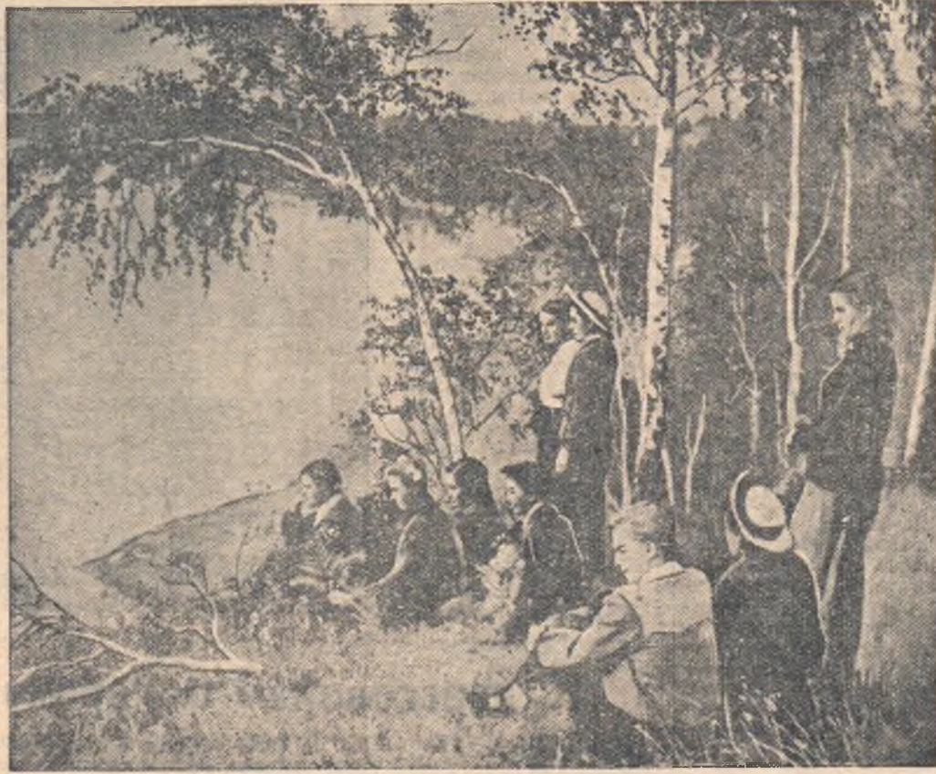
Юные краеведы Омска в окрестностях туристского лагеря Дома пионеров.

М. ПАВЛОВИЧ, зав. отделом пионеров райкома ВЛКСМ.