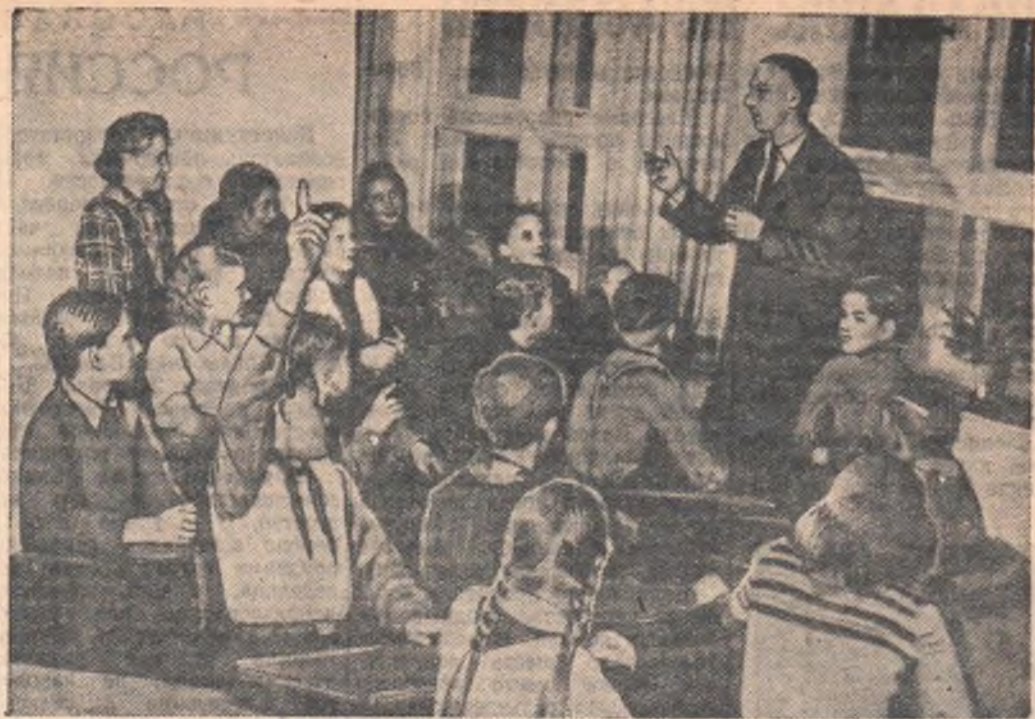
В Германской демократической республике растет сеть школьных учреждений. Новая школа-десятилетка открылась недавно в городе Губене. Школа была заложена в честь 75-летия со дня рождения Вильгельма Пика. НА СНИМКЕ: в одном из классов новой школы.