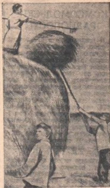
НА СНИМКАХ: сверху — машинист конной сенокосилки Тит Подобед; внизу — на скирдовании сена.

В этом году колхозному скоту будет обеспечена сытая и теплая зимовка.