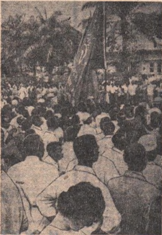
Жители Гаваны получили недавно на торжественной церемонии грамоты от имени Национального института аграрной реформы на право владения землей.