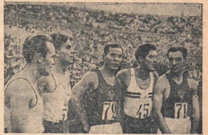
В Москве, на центральном стадионе «Динамо», проводятся международные товарищеские легкоатлетические состязания, в которых принимают участие сборные команды Советского Союза, Польской Республики и Румынской Народной Республики.