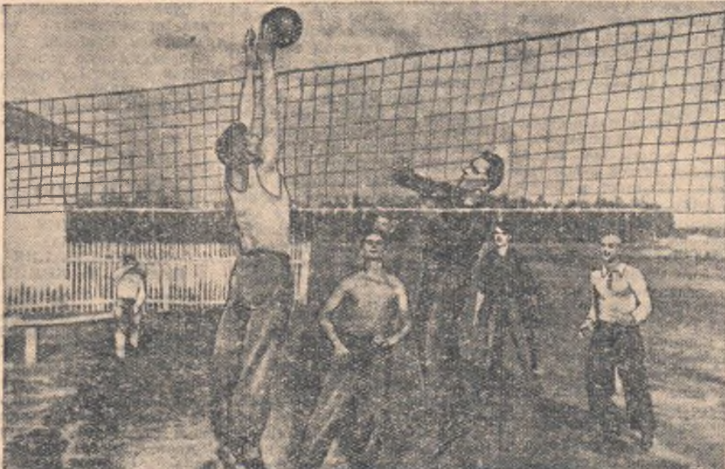
НА СНИМКЕ: тренировочная игра молодежи Сосновского зерносовхоза на волейбольной площадке перед районной спартакиадой.