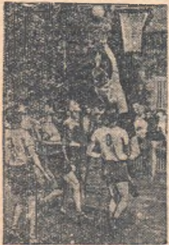
Момент игры между баскетболистами Омска и Красноярска. Атакуют омики.