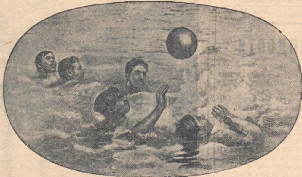
Учащиеся железнодорожного училища № 1 — любители водного спорта. НА СНИМКЕ: юные спортсмены училища играют в водное поло.