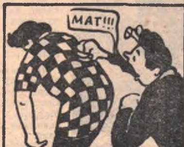
Изошутка В. Семенова (Омск).