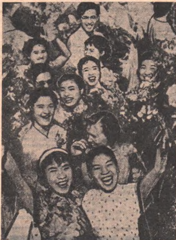
Кадры фильмов расскажут...

... Русская задорная пляска сменяется медленным армянским танцем, огневой молдавский «жок» — лирической азербайджанской народной песней. Своим мастерством демонстрируют артисты Латвии, Белоруссии, Туркмени, Эстонии и других советских республик.