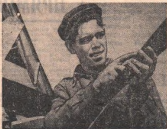
(Окончание на 3-й стр.)