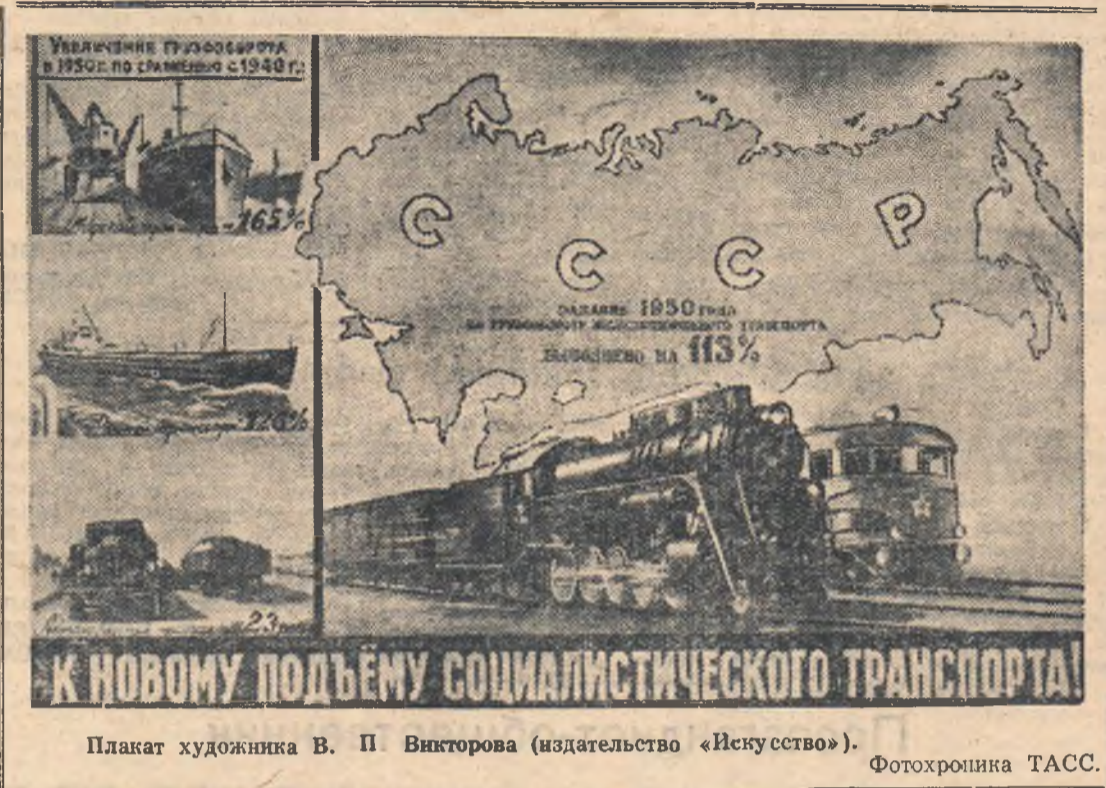
Плакат художника В. П. Викторова (издательство «Искусство»).

Перед железнодорожниками Омской стоят сейчас ответственные задачи: четко соблюдать график движения поездов, с честью выполнять государственный план перевозок, умножать ряды пятисотников, стахановцев, новаторов, по-боевому готовиться к сибирской зиме. Решить эти задачи так, как этого требуют интересы Родины, — значит досрочно, по-деловому ответить на сталинскую заботу о советских железнодорожниках.