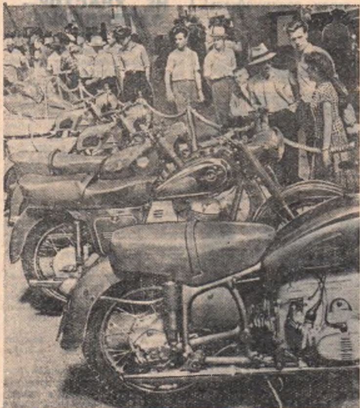
Выставка достижений народного хозяйства СССР. В павильоне «Машиностроение». Новые модели мотоциклов.