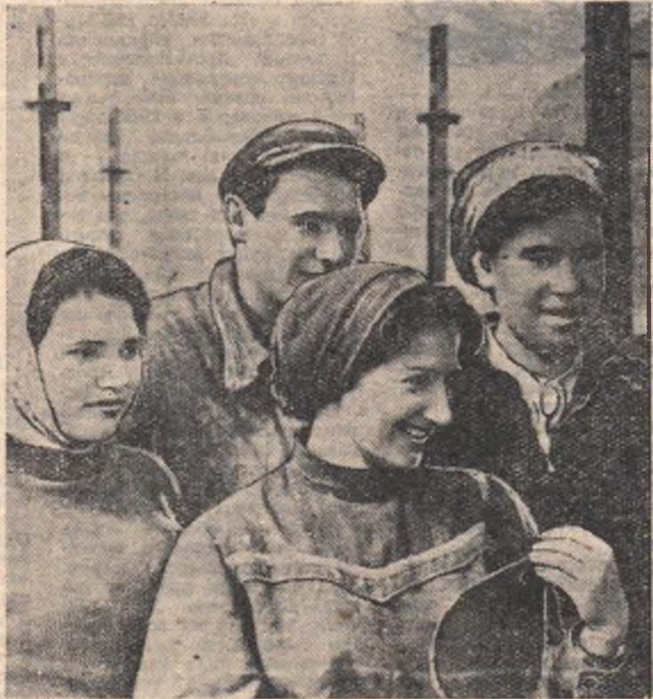
* Недавно шестнадцать молодых рабочих первого строительного участка треста «Омсктрансстрой» закончили производственное обучение на курсах штукатуров. Всем юношам и девушкам присвоена квалификация штукатура четвертого разряда.

секретарь парторганизации колхоза имени Ворошилова, Тарского района.