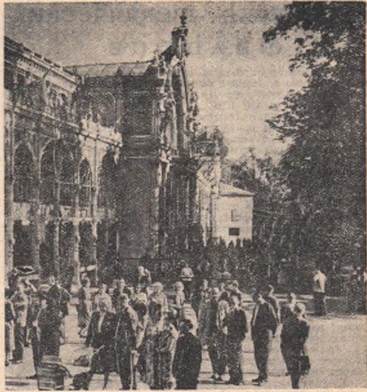
Чехословацкая Республика. Народное государство уделяет большое внимание охране здоровья трудящихся. В стране насчитывается более 50 санаториев, где трудящиеся лечатся и отдыхают. В первом квартале 1959 года бесплатные путевки на курорты получили 55 тысяч человек.

НА СНИМКЕ: колоннада имени Максима Горького в городе-курорте Марианске-Лазне.