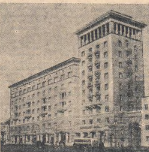
Москва. Новый дом на Садовой улице. (Новинский бульвар).