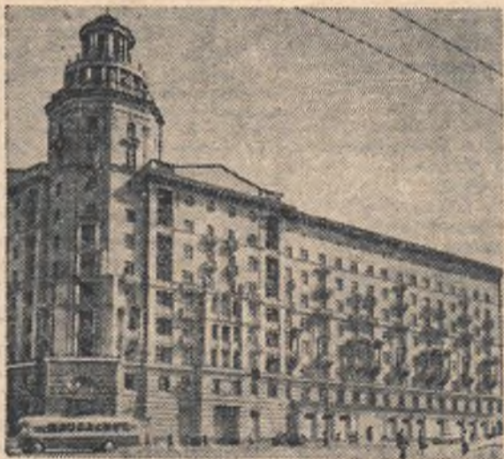
Москва. Новый жилой дом на Садово-Сухаревской улице.