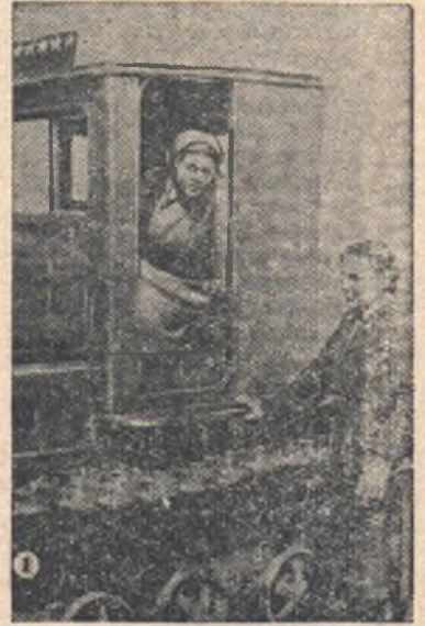
А внизу вы видите всю бригаду в сборе. В свободный час молодые механизаторы читают газеты, журналы, книги.