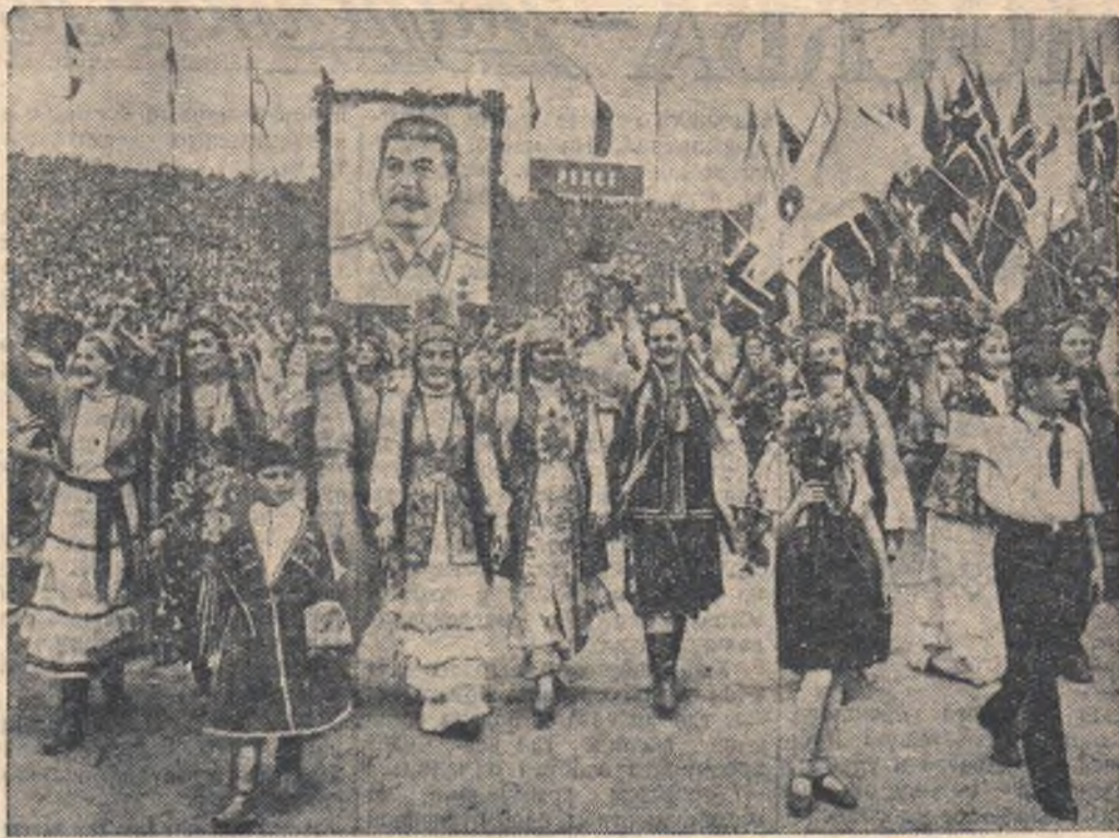
5 августа в Берлине на стадионе имени Вальтера Ульбрихта в торжественной обстановке открылся Третий Всемирный фестиваль молодежи и студентов в защиту мира.