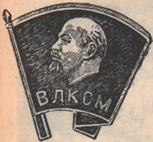
Новый значок члена ВЛКСМ