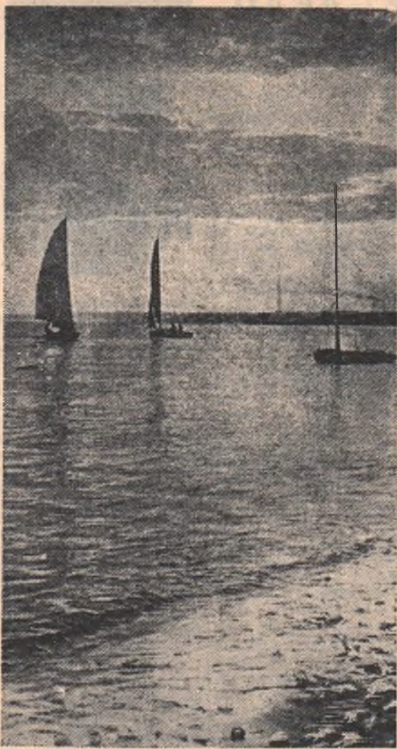
Вечер на Иртыше.