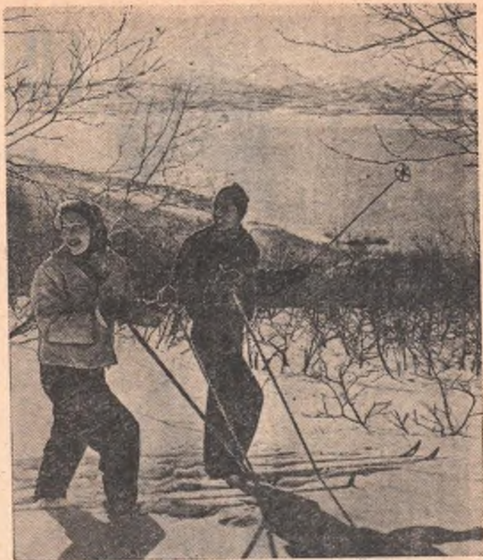
На лыжной прогулке.

— Неправду про собрания говорят — Мол, все они у нас однообразные! — И впрямь стоит десятый раз подряд в повестке дня вторым вопросом «Разное!»