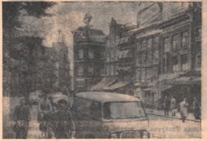
Голландия. Улица в центре Амстердама.