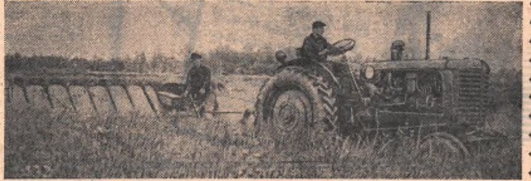
Колхозники сельхозартели «Заря коммунизма», Тарского района, ежегодно получают большой доход от выращивания льна. Хорошо работает на полях этого колхоза льнотеребильный агрегат тракториста Ивана Лопатина и льнотеребильница Семена Маркина. НА СНИМКЕ: льнотеребильный агрегат за уборкой льна.