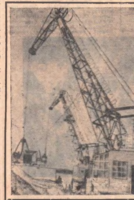
Фото и текст Н. БРЕВНОВОЙ.

С каждым днем возрастает объем жилищного строительства в нашем городе. Все больше нужно строителям песка и других стройматериалов. Сейчас на Иртыше 11 плавучих кранов Омского порта ведут добычу песка для удовлетворения нужд строителей города.