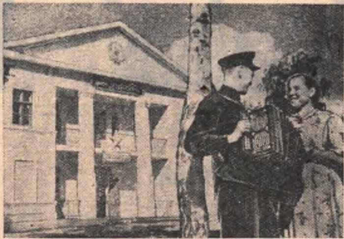
Культурно проводят свой досуг жители райцентра Саргатского района. К их услугам имеется хороший Дом культуры, которым по праву гордятся саргатцы. Здесь демонстрируются кинофильмы, читаются лекции, проводятся вечера молодежи.