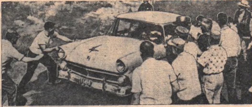
Соединенные Штаты Америки. В Мартино-Ферри (штат Огайо) проводится забастовка на предприятиях Мак Дауэлл компании инкорпорейшн. Она длится свыше месяца. Бастующие не пустили автомобили, пытавшиеся проникнуть на предприятие для погрузки стали. Они дали также отпор полиции. НА СНИМКЕ: бастующие останавливают полицейский автомобиль.