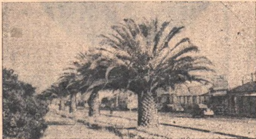
Австралия. Аделаида. Бульвар, ведущий от порта к центру города.

Криптолемус успешно используются также против вредителей виноградно-лозы — червца и вредителя чайного растения — пухлякария. (ТАСС).