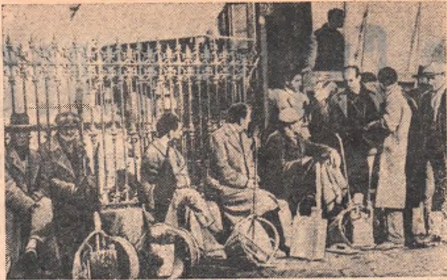
Италия. Безработные строители на улице Неаполя. Они часами ждут случайной работы, но часто им приходится возвращаться к семье, не заработав ни лиры.

Большевики еще раз увидели, что власть можно взять только путем вооруженного восстания против буржуазного правительства и его мелкобуржуазных приспешников.