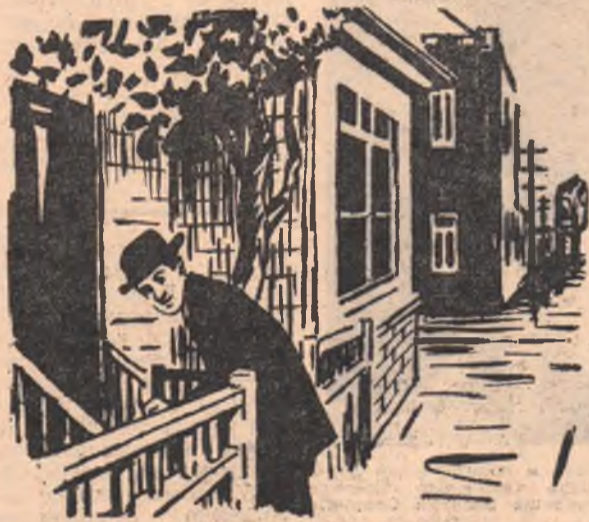
... Он прячется от знакомых и соседей, боясь, что они вдруг попросят займы денег... Рис. Г. Плющакова.

Говорят: человек создан для счастья, как птица — для полета. Сравнение не случайное. Самое счастье, если хоти-