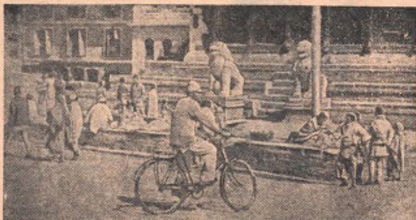
Непал. На одной из улиц города Катманду.

✽ Финляндская газета «Ууси Суоми» сообщила о состоянии посевов советских семян кукурузы на усадьбе земледельца Туомаса Пеура, хозяйство которого посетили Н. С. Хрущев и Н. А. Булганин во время