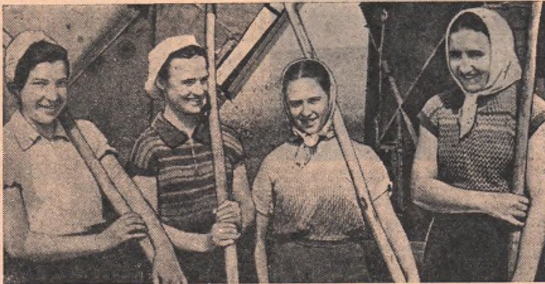
Более 800 юношей и девушек — посланцев комсомольцев города Иваново помогают убирать урожай колхозам и совхозам Исиль-Кульского района.

В транторных и полеводческих бригадах, на тонах — повсюду с комсомольским огоньком и задором трудятся студенты и учащиеся. Многие из них включились в агитационно-массовую работу, участвуют в сельской художественной самодеятельности.