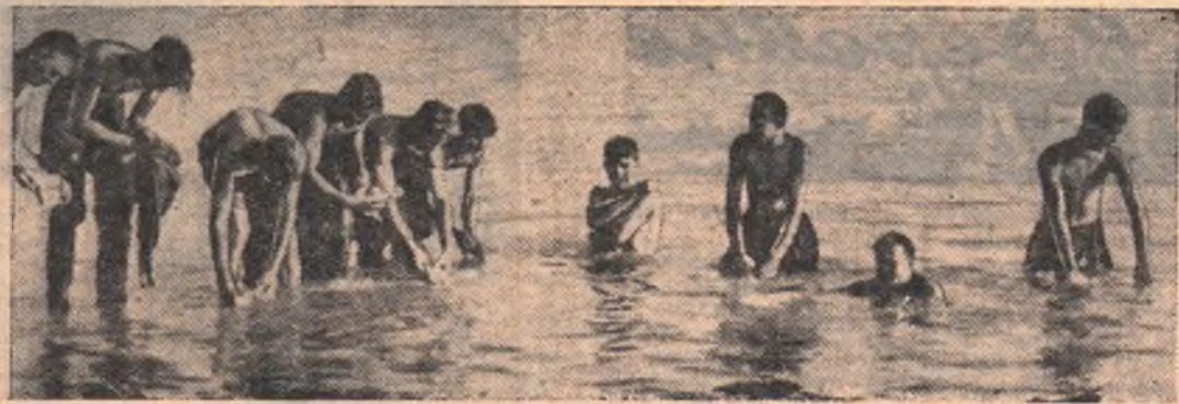
В сельхозартель имени Чапаева, Ульяновского района, прибыла помогать колхозникам в уборке нового урожая группа молодежи из Калужской области. НА СНИМКЕ: молодые калужане после трудового дня.