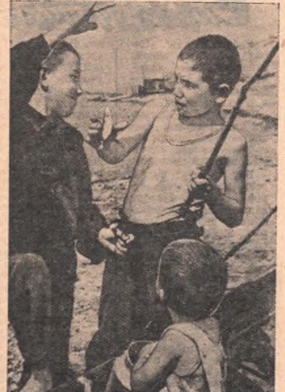
Поймали! (Черлак).