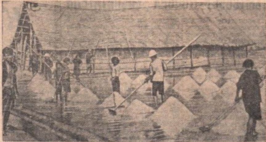
Таиланд. Добыча соли в центральном районе страны.

курят и проявляют особое усердие в танце стилем. Невольно напрашивается вопрос: почему администрация парка продает билеты подросткам? Почему их пропускают на танцплощадку? Видимо, администрации есть дело только до выручки, а все остальное ее не касается. Думается, что Октябрьскому райкому комсомола следовало бы напомнить администрации Парка, что танцевальная площадка — не только коммерческое предприятие. П. МАТЮХИН, комсорг цеха.