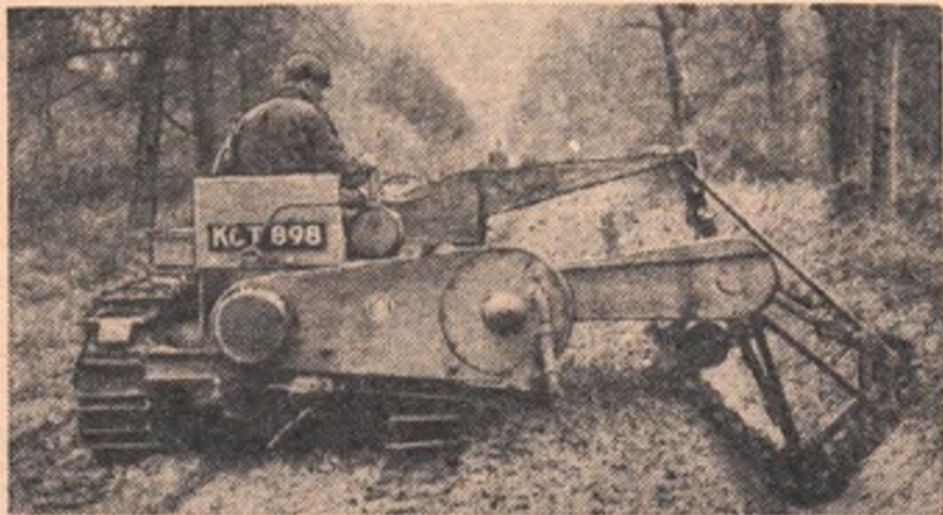
В дорожном хозяйстве Англии широко используются для очистки кюветов и канав машины «Линкол». Изготавливаемые в Англии машины типа «Линкол» применяются и в сельском хозяйстве. Двигаясь вдоль кювета или канавы, агрегат вычищает ил, грязь или траву. Агрегат установлен на тракторе и приводится в движение тракторным двигателем через роликовую цепь.

На днях священник Шаттлуорт, возглавляющий борьбу негров против сегрегации, появился возле здания школы, намереваясь записать свою 12-летнюю дочь и еще нескольких негритянских детей в «белую школу» на новый учебный год. На него напала банда расистских хулиганов, которые жестоко избивали его железной цепью.