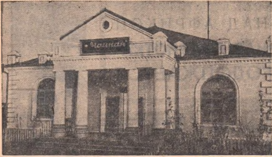
С каждым годом растет и благоустраивается один из районных центров области — село Таврическое. Его облик украшают новый добротный Дом культуры, просторная светлая чайная и другие здания. На снимке: новая чайная.