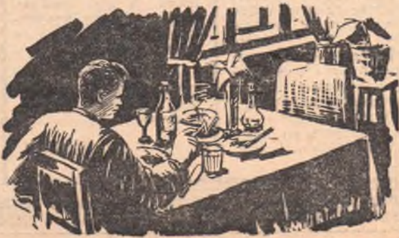
Время от времени Толмачев стал выпивать. Рис. Г. Плюшанова.