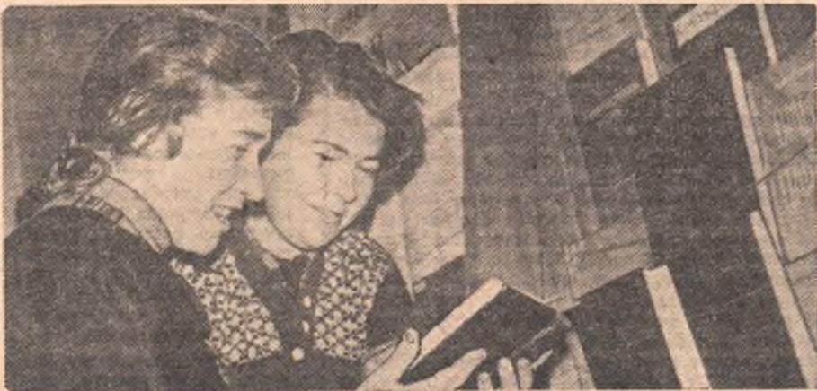
В библиотеке имени А. С. Пушкина открыта выставка, посвященная сорокалетию речи Владимира Ильича Ленина на III съезде комсомола. Посетители читального зала с интересом знакомятся с ее экспонатами.

Добрым напутствием в большую жизнь прозвучит для будущих комсомольцев приветствие младших товарищей — пионеров и октябрят. Затем из рук старых большевиков, как эстафету революционных традиций, они получают комсомольские билеты с силуэтом Владимира Ильича Ленина.