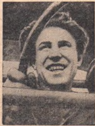
Репортаж подготовили Л. ЕФРЕМОВА, С. ТАРАНОВ, Э. КОНДРАТОВ.