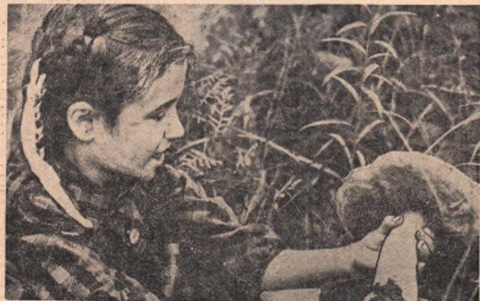
Вот это гриб!