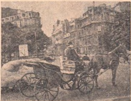
Франция. На улицах Парижа.

Новый очаг культуры вступит в строй в будущем году.