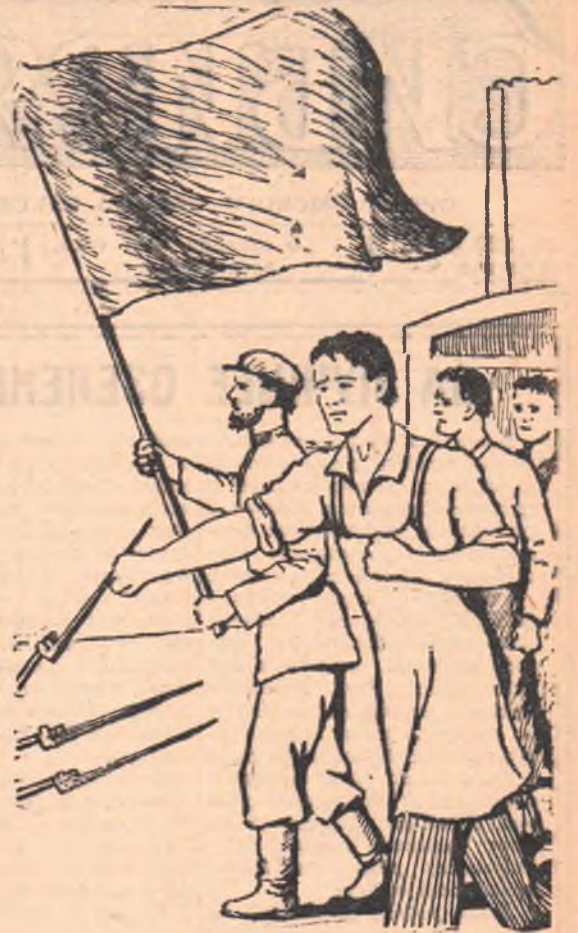
Рис. Г. Плещанова.

Молодой омич! Еще в 1895 году омский пролетариат открыл первую страницу летописи своей революционной борьбы. Тогда строители омского железнодорожного вокзала провели экономическую стачку, за которую многие рабочие попались тюремным заключением. В 1898 году состоялась крупная забастовка в главных железнодорожных мастерских и депо. В ней молодые рабочие участвовали уже не стихийно, а выступили монолитной молодежной группой. Сегодня мы расскажем тебе, юный товарищ, о руководителях и организаторах первой молодежной группы омских революционных рабочих, о ее активной борьбе с царскими порядками.