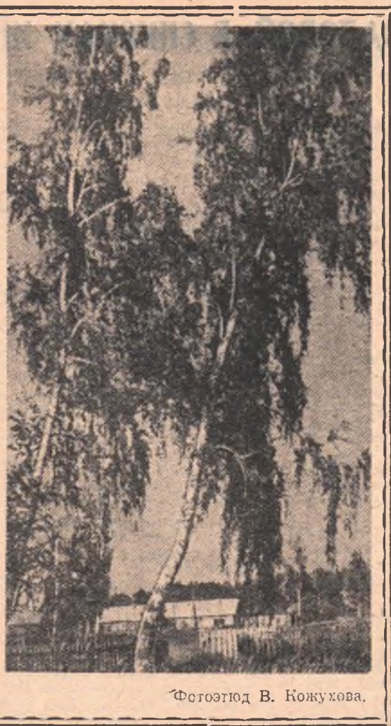
Фотоэтиюд В. Кожухова.