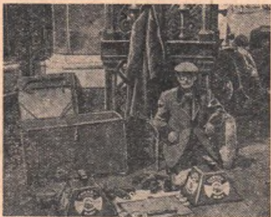
Англия. Чистильщик обуви на улице Лондона.