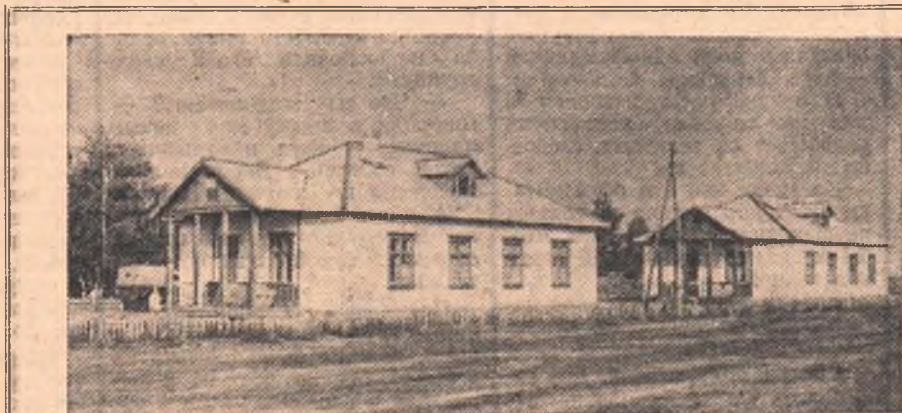
Широко развернулось строительство жилых домов в совхозе «Розовский», Русско-Полянского района. НА СНИМКЕ: новые дома для труженников совхоза.