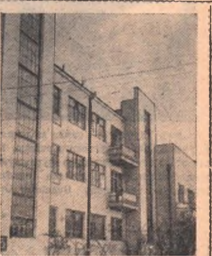
НА СНИМКЕ: здание Омского института физической культуры.

* В СССР развивается 60 видов спорта, насчитывается 19 миллионов физкультурников. Около 3,5 милли-