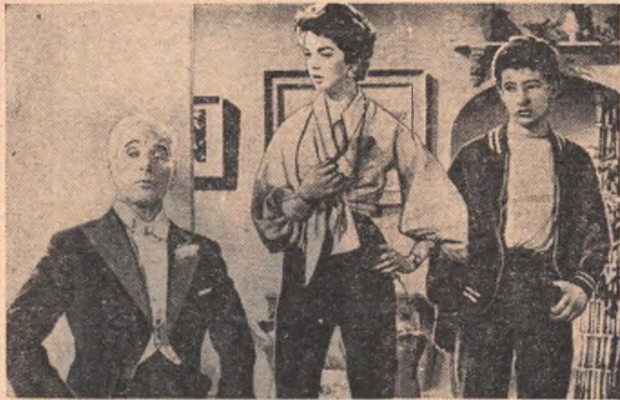
Недавно замечательный мастер кино Чарли Чаплин закончил работу над новой кинокомедией «Король в Нью-Йорке».

Кинофильм повествует о злоключениях в Нью-Йорке короля некоего европейского государства Эстровии, бежавшего от революции в Америку со своим премьер-министром.