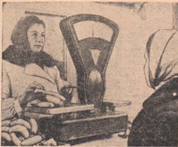
Белая пелена покрыла крыши домов, газоны сиверов, тротуары. В Омск пришла зима. А на улицах города идет бойкая торговля фруктами: яблоками, виноградом, бананами.

токарь ремонтно-механических мастерских треста № 1.