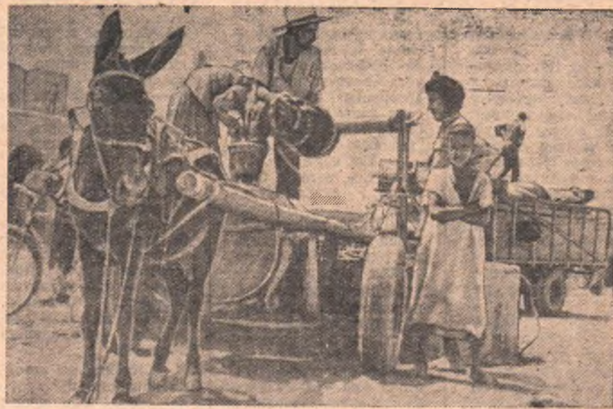
Марокко. На улицах города Гулиминс.