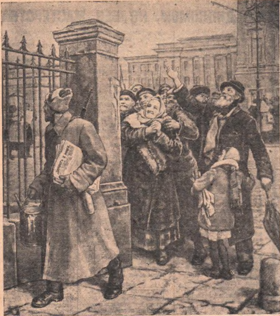
«Первый декрет Советской власти», Картина художника А. И. Сегала.