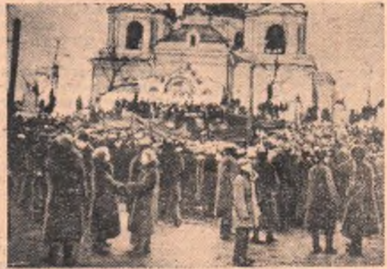
кие хибарки, в которых ютилась рабочая беднота. Эта окраина города