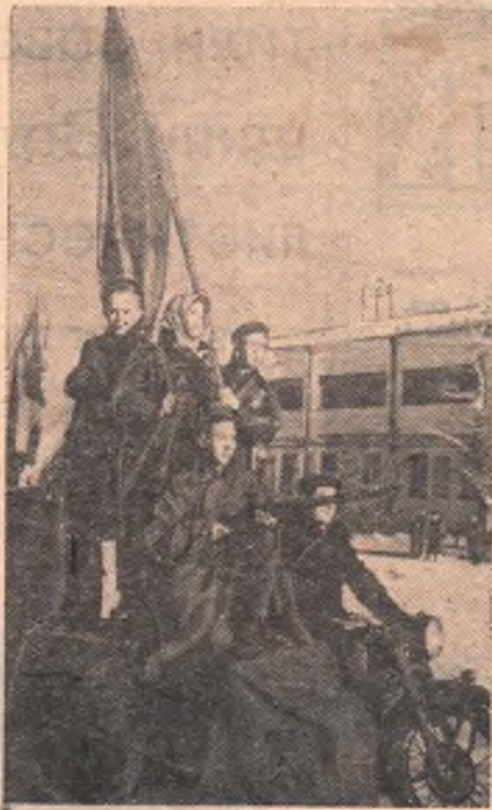
Идут юные ленинцы. Над их колонной возвышается символическая группа — вооруженные винтовками солдат, матрос и рабочий.