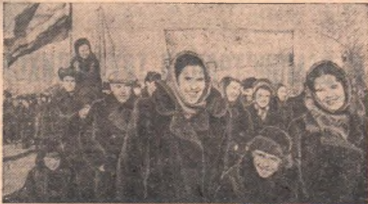
Живой рекой влилась на Центральную площадь и потекла мичо трибуны демонстрация.

ЖИВОЙ рекой влилась на Центральную площадь и потекла мичо трибуны демонстрация. Ноябрьский ветер надует полотнища — «Слава КПСС!», «Да здравствует Великая Октябрьская социалистическая революция!». Развеваются флаги, как живой, встал над демонстрантами с протянутой рукой Ленин, щурит радостные глаза с транспарантов. Торжественно звучит оркестр.