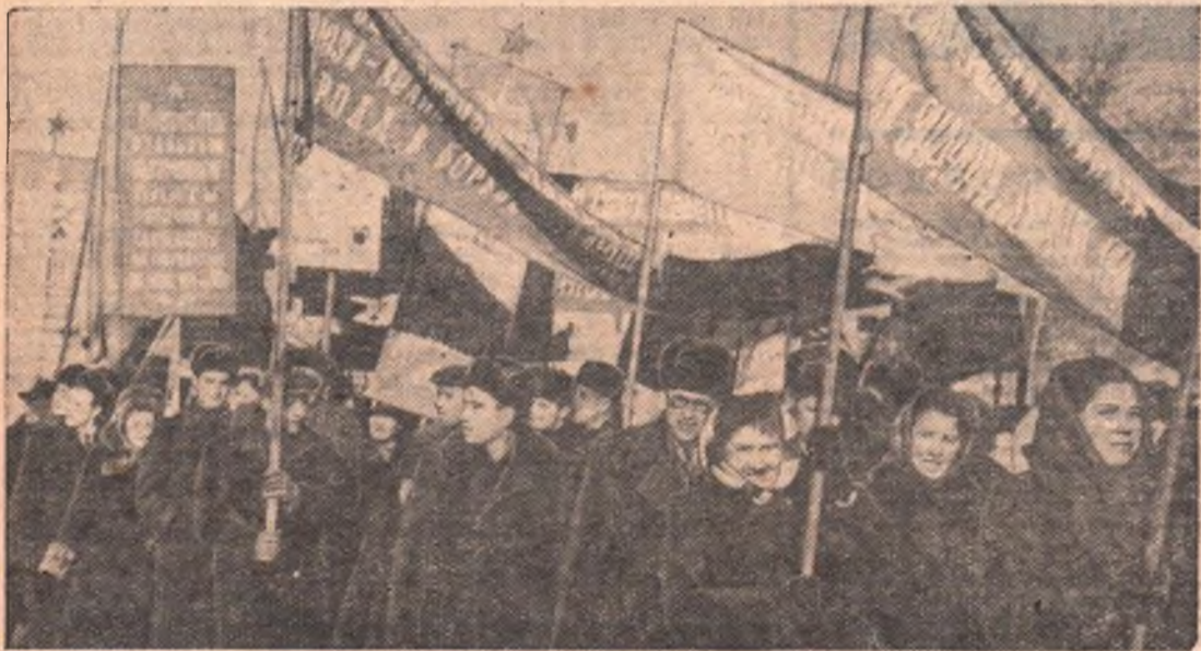
Торжественно звучит оркестр. «Смело, товарищи, в ногу!