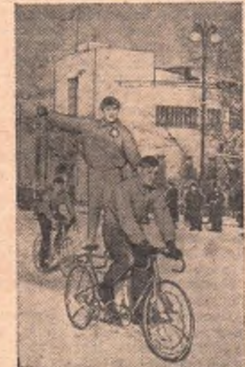
Район сменяет район, предприятия — институты и техникумы, а многочасовая демонстрация все не прекращается.

В черных форменных шинелях и серых ушанках проходит перед трибуной младшая смена рабочего класса — учащиеся школ и училищ Трудовых ре-