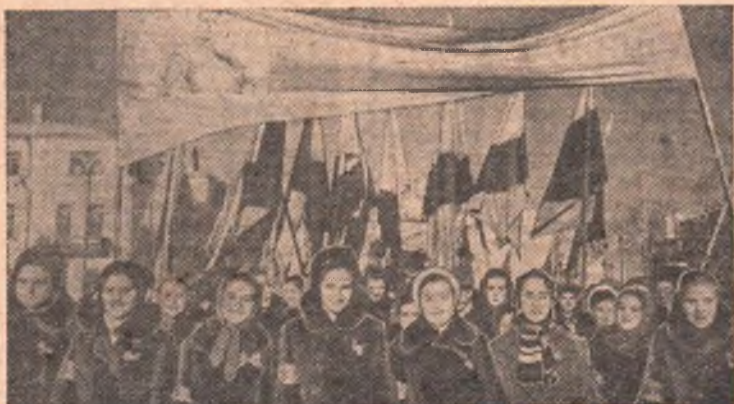
Идут учащиеся. Им вместе со старшими братьями воплощать в жизнь исторические постановления нашей мудрой партии и родного Советского правительства.

Район сменяет район, предприятия — институты и техникумы, а многочасовая демонстрация все не прекращается. Трудящиеся Омска называют все новые и новые трудовые победы. Проходят люди, профессий которых прежде не знал Омск, — нефтяники, машиностроители, комбайнстроители, энергетики и десятки других. Даже бывшего «путиловского внучонка» — наш Сибзавод — не узнают деды. И ясные счастливыми улыбками их лица разглаживаются морщины. С молодым городом и сами они