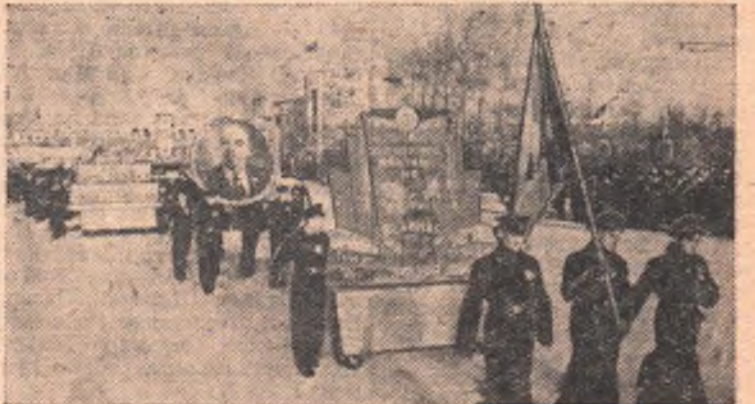
В форменных шинелях и серых ушанках проходит перед трибуной младшая смена рабочего класса — учащиеся школ и училищ Трудовых резервов.