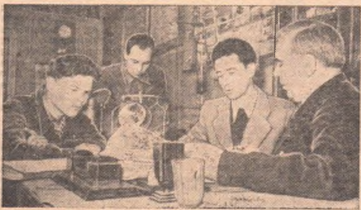
В автодорожном институте ведется комплексное исследование службы и эксплуатации вновь сооруженных автомобильных дорог в районах целинных земель Омской области, Алтайского края и Казахстана.