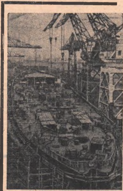
ЛЕНИНГРАД. На строительстве атомного ледокола «Ленин». НА СНИМКЕ: общий вид строительства ледокола.