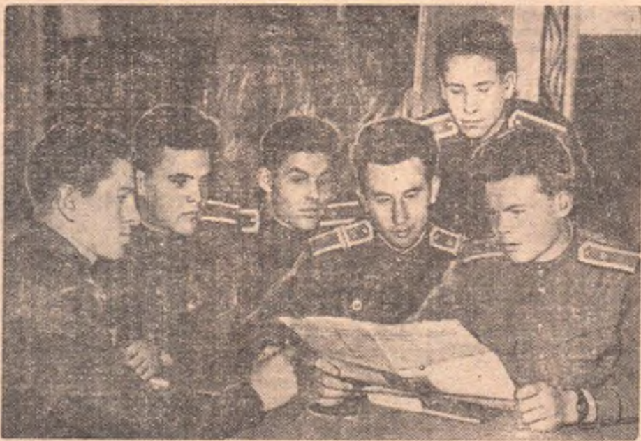
Внимательно следят за событиями, происходящими в стране и за ее пределами, курсанты Омского военного училища имени М. В. Фрунзе

А. ШРАМ, зав. внештатным отделом пионерской двухлетки редакции «Молодого сибиряка».