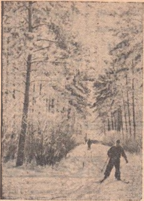
Хорошо пробегаться на лыжах.