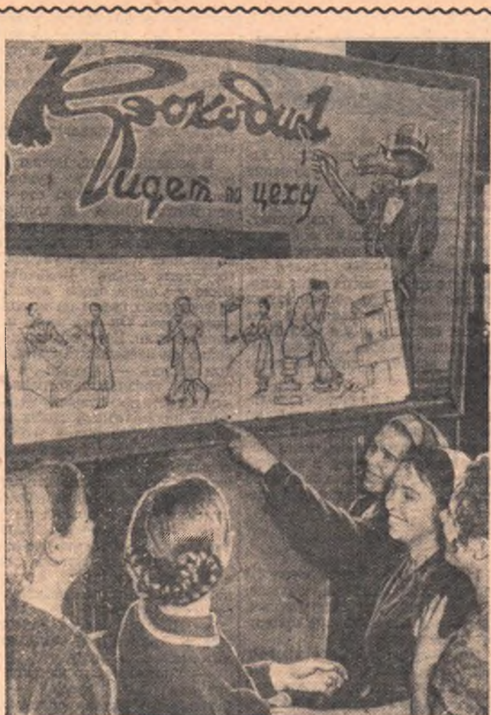
На заводе «Омэлектроточприбор» в цехе № 3 на самом видном месте вывешена сатирическая стенгазета «Крокодил идет по цеху». Хорошо работает редколлегия ее. Ни одно нарушение трудовой или производственной дисциплины не проходит мимо все видящего и все слышащего «Крокодила». До начала смены и после работы, в обеденный перерыв у стенгазеты всегда многолюдно.