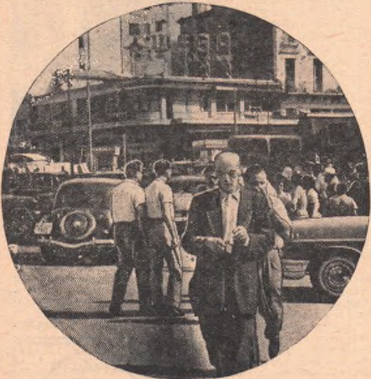
Греция. В центральной части Афин.

Были брошены ручные гранаты, которые взорвались вблизи Президента, но не причинили ему вреда. Имеются убитые и раненые. Спустя несколько часов после покушения на него Президент Сукарно выступил по радио. Он выразил глубокое соболезнование пострадавшим и призвал индонезийский народ к укреплению национального единства и к бдительности по отношению к врагам республики.