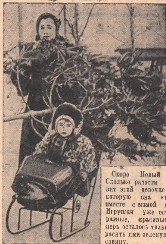
Скоро Новый год. Сколько радости доставит этой девочке елка, которую она «везет» вместе с мамой домой. Игрушки уже есть — разные, красивые. Теперь осталось только украсить ими зеленую красавицу.