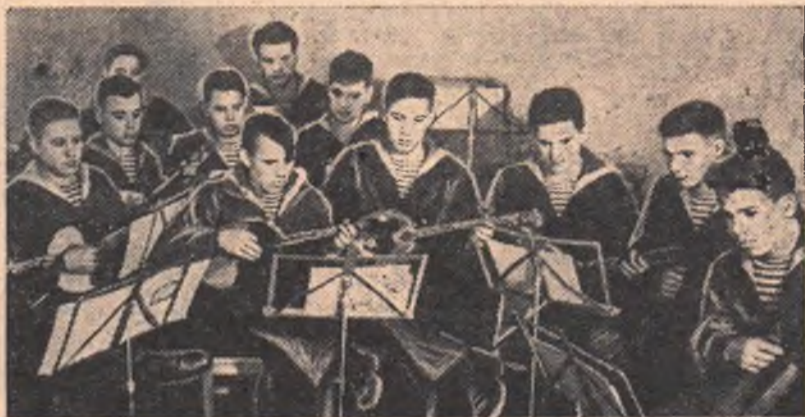
Приближается радостный праздник — Новый год. Юноши и девушки готовятся отметить его как можно ярче, веселее. На этом снимке вы видите струнный оркестр Омского речного училища. Курсы-музыканты готовятся к новогоднему концерту.

Телевизионная камера, созданная в институте, значительно отличается от систем прежнего типа. Она проще по устройству, легче в управлении и дает четкое цветное изображение предметов. Новая камера может быть использована и в телевизионных центрах, передающих черно-белые изображения.