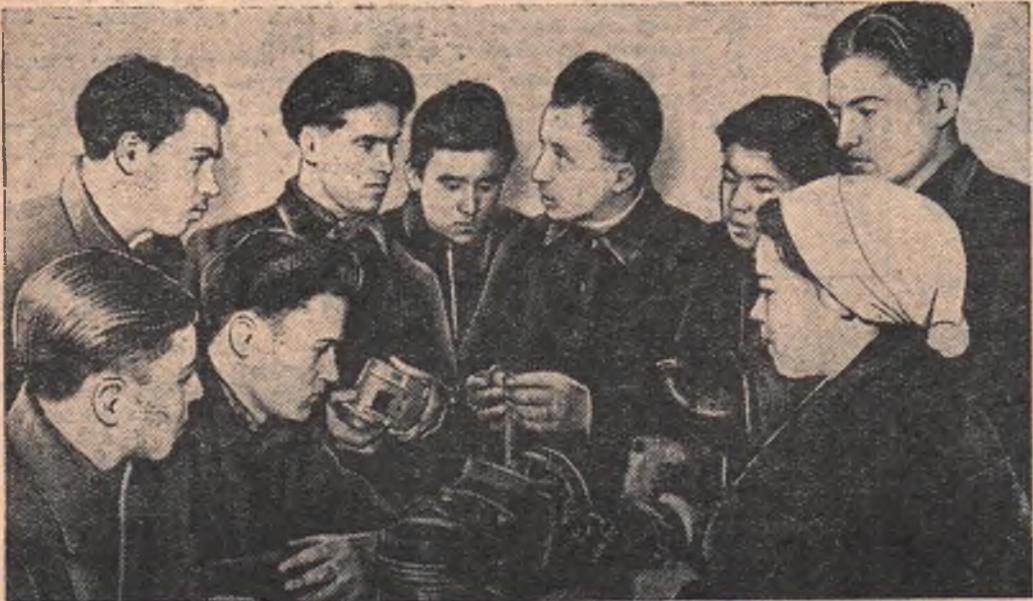
В Павлоградском совхозе организованы курсы механизаторов. Здесь молодые рабочие получают новую специальность — тракториста. Сейчас на курсах обучается 27 человек, в основном комсомольцы. Весной они поведут трактора по совхозным полям.

Д. КУЧИНСКИЙ, комбайнер Сосновского совхоза.