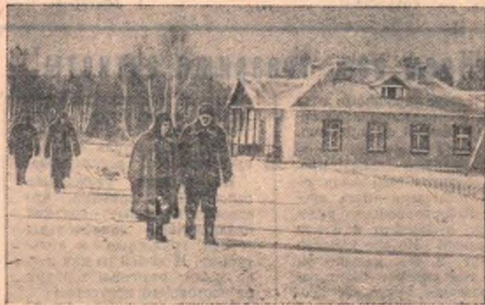
Год от году все больше и краше становятся поселки новых совхозов. Хорошо ведется жилищное строительство в целинном совхозе «Розовский».