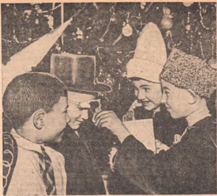
Интересно прошла новогодняя елка у учащихся младших классов средней школы № 85. Почти все ребята пришли в маскарадных костюмах. Весело отпраздновали малыши!