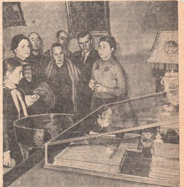
Дом-музей В. И. Ленина в Горках посещают сотни трудящихся. Особенно много экскурсантов бывает здесь сейчас в связи с приближающейся знаменательной датой — 90-летием со дня рождения великого вождя. С большим интересом приезжающие знакомятся с материалами и документами, рассказывающими о жизни и деятельности Владимира Ильича.

Решено объявить 22 апреля днем коммунистического труда.