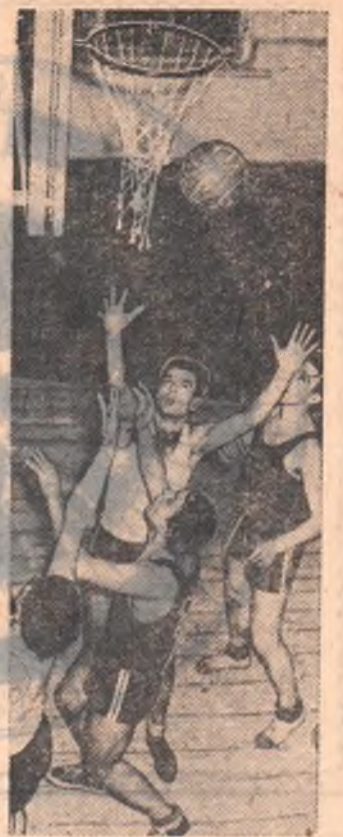
ОМСК. Состоялся розыгрыш зимнего первенства города по баскетболу среди команд первой группы. Одной из интересных встреч была игра между спортсменами института физкультуры и коллективом «Молнии». На нашем снимке запечатлен момент игры этих команд.