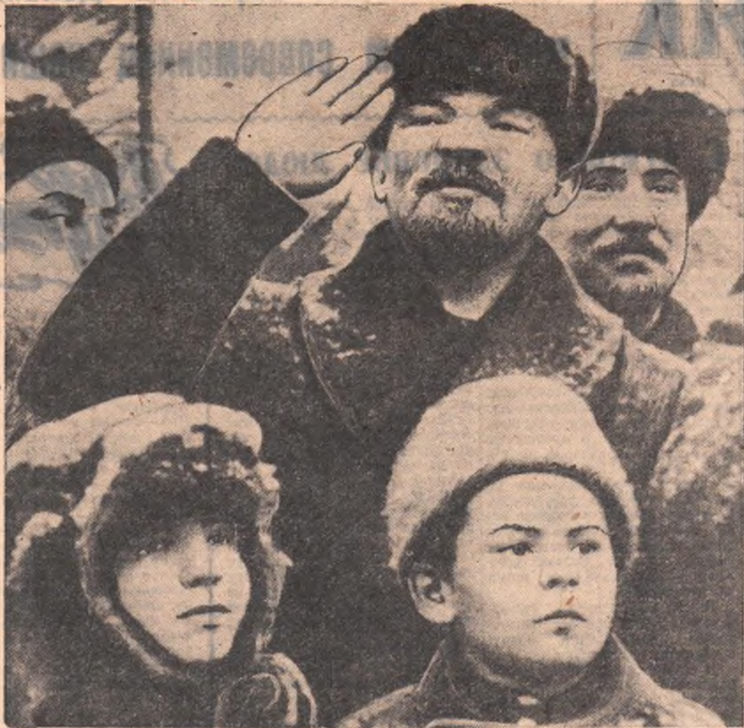
В. И. ЛЕНИН на Красной площади во время празднования II годовщины Великой Октябрьской социалистической революции, Москва, 7 ноября 1919 года, кинокадр. (Из альбома, подготовленного к выпуску Институтом марксизма-ленинизма при ЦК КПСС).