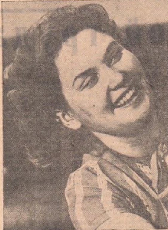
ФОТОЭТЮД В. ЛИПОВСКОГО.