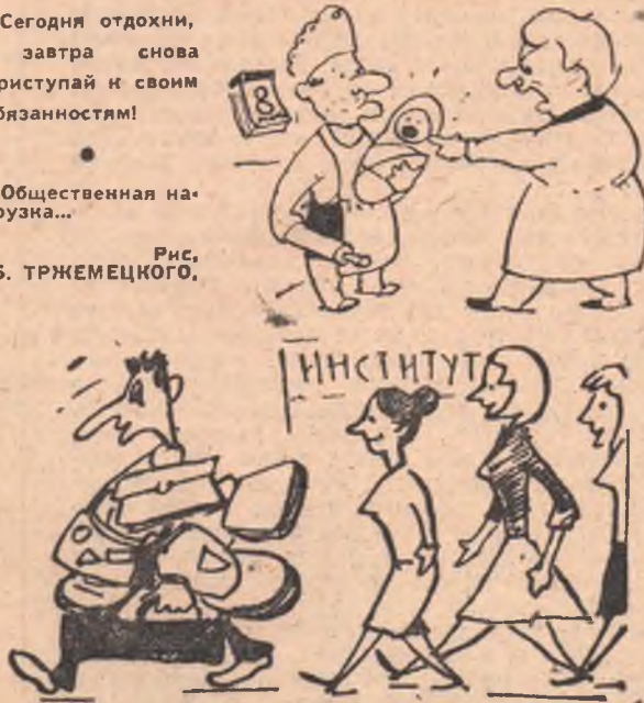
Рис. Б. ТРЖЕМЕЦКОГО.