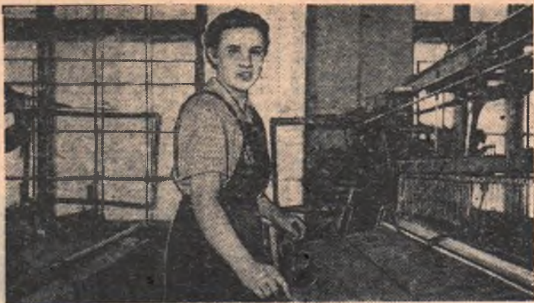
ЧЕСТЬ ИНСТИТУТА—ТВОЯ ЧЕСТЬ