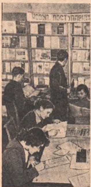
Всегда бывает многолюдно в областной библиотеке имени Пушкина. Это и понятно. Ведь здесь можно получить любую нужную книгу, журнал, газету.

НА СНИМКЕ: в читальном зале технических новинок.