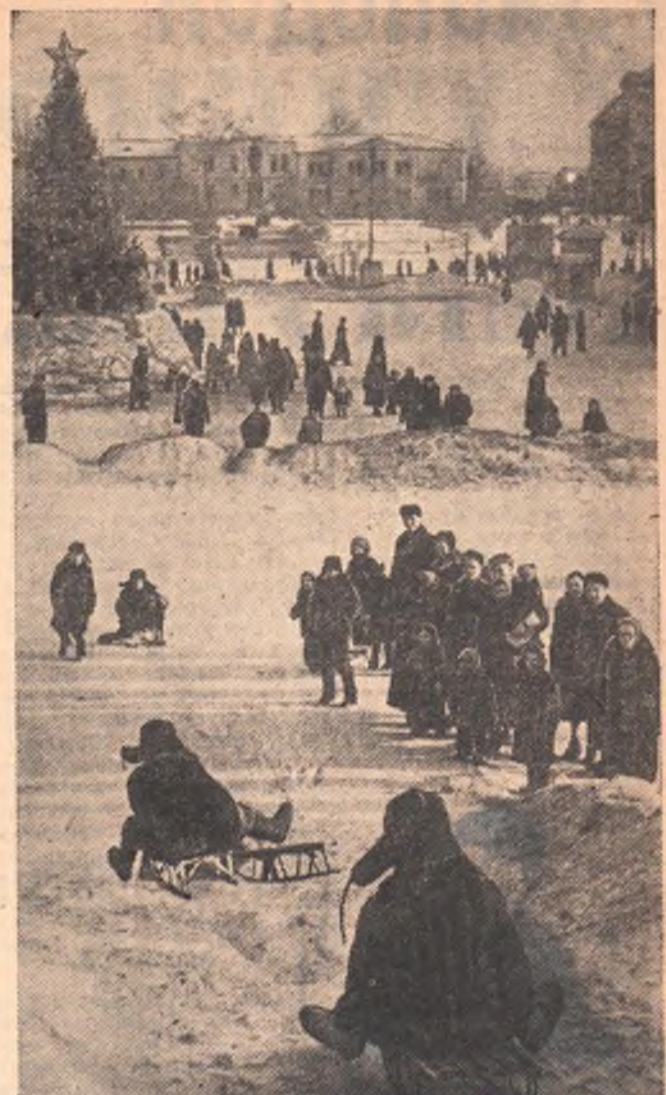
Напротив кинотеатра «Пионер» для юных омичей установлена нарядная елка и залита большая горка. Весело проводят свой досуг ребята!

Пусть же не будет места равнодушию в наших сердцах, пусть ярче горит у каждого «огонек».