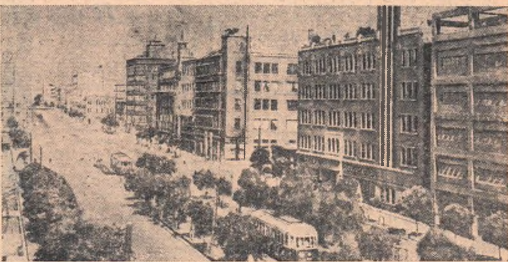
Китайская Народная Республика. На одной из улиц города Дальнего.