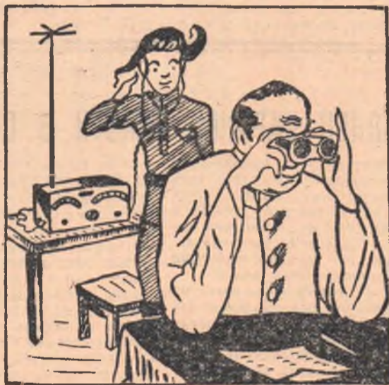
— Товарищ начальник, разрешите доложить? — Докладывайте, докладывайте. — Связь с Азово окончательно прервана.

Товарищи из Омского областного комитета ДОСААФ неудовлетворительно руководят деятельностью сельских первичных досаафовских организаций, редко выезжают на места, а потому порой не знают, в чем они нуждаются.