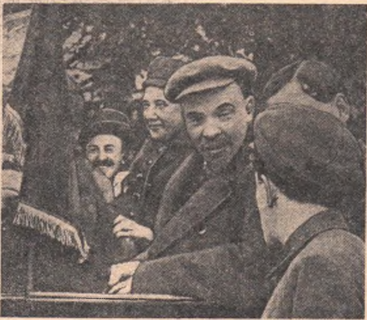
Кадр из кинофильма «Воспоминания о В. И. Ленине». В. И. Ленин и Н. К. Крупская у рабочих Рублевской водоначки, 1 мая 1919 года.