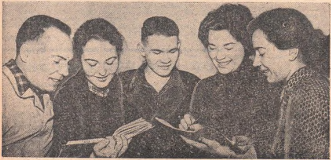
Эта группа молодых людей — учащиеся Тарского медицинского училища. Все они отличники учебы. Скоро для них со-